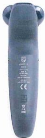
Philips Lengte 16.5 cm Breedte 4.1 cm

8. Het gewicht is nagenoeg gelijk. De Philips weegt 183 gram, de Lidl 177 gram.