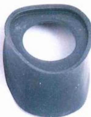
rubber kraag los

22. De hals bestaat uit een geribbeld zwart manchet; bestaande uit drie ringen.