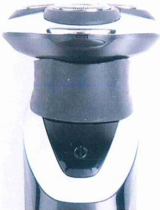
rubber kraag gemonteerd

21 . Bij het Lidl Scheerapparaat heeft men naar mijn mening tevergeefs getracht de vrijwel identieke vormgevingskenmerken van de hals van het scheerapparaat te verhullen met een afneembare eenvoudige rubberen zwarte kraag, die ook de versmalling benadrukt tussen de scheerkopouder en de handgreep. De kraag heeft geen functie en kan naar mijn mening door bij gebruik en reiniging eenvoudig worden verwijderd. Tevens is de ring onhandig bij het plaatsen van de scheerkop of tondeusekop.