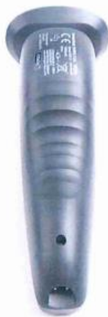
Lidl Lengte 16.7 cm Breedte 4.3 cm